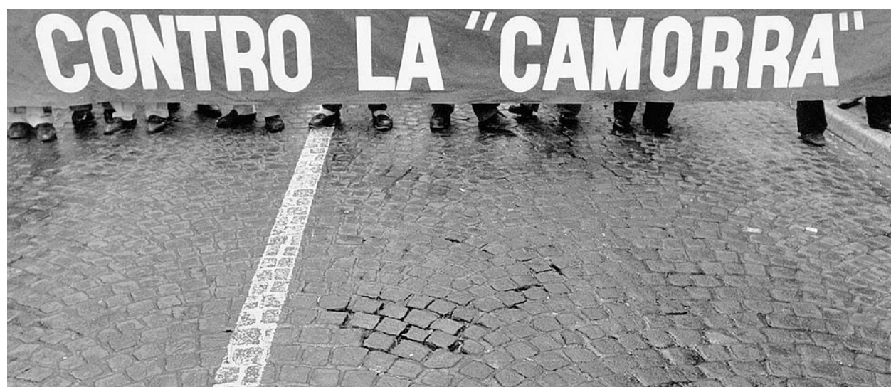
In bianco e nero Scatto d'autore per un corteo anticlan che attraversa le strade di Napoli negli anni '80.

La recensione Il saggio di Franco Barbagallo