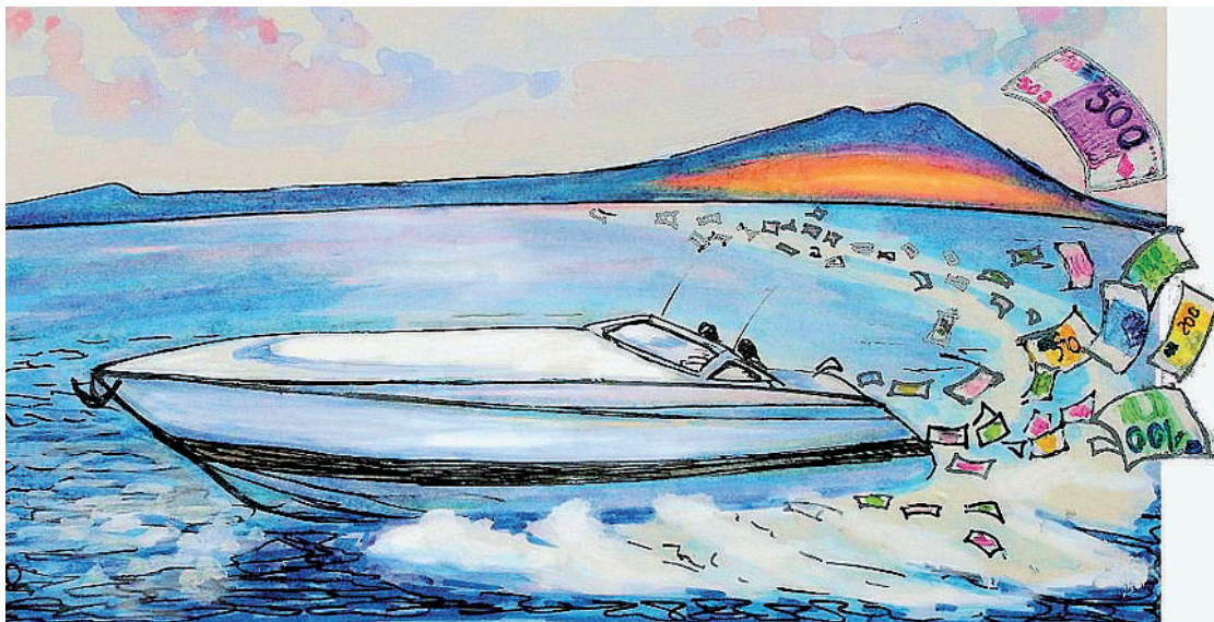
Barche «illegali» Disegno di Federica Rispoli

Il proprietario: è questo il punto. Quando non vogliono farsi trovare, le provano tutte. «È molto diffuso un fenomeno che noi chiamiamo delle "bandiere di comodo": alcuni possessori iscrivono le proprie imbarcazioni nei registri stranieri delle navi da diporto, operazione che spesso è anche troppo semplice da portare a termine. A vol-